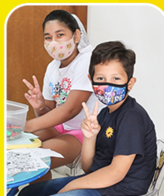
ALEGRIA É O MELHOR REMÉDIO