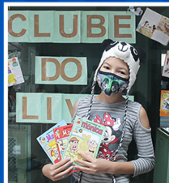
CLUBE DO LIVRO