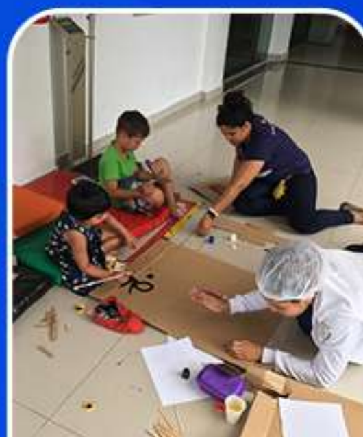
ALEGRIA É O MELHOR REMÉDIO